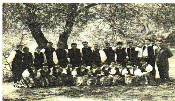
Krojovaná družina 1969